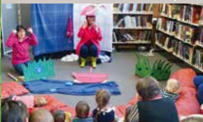
Mars en livres