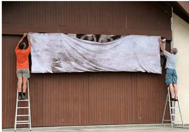
Etendage en public du plus grand Van Dyke

Cinq minutes plus tard, les acteurs se relèvent. Le Van Dyke est désormais plié et mis à l'abri de la lumière. Après 2h de traitement pour les opérations de fixage et de lavage, voilà le plus grand Van Dyke prêt à se révéler au public.... séquence émotion pour les acteurs, les spectateurs nombreux et les organisateurs! Great !