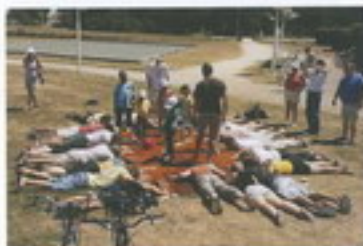
Insolation du plus grand Van Dyke

Le soleil chauffe, les acteurs transpirent et l'épreuve vire vite, très vite, au jaune "chaud" puis vers l'orange jusqu'à une couleur rouille écarlate.