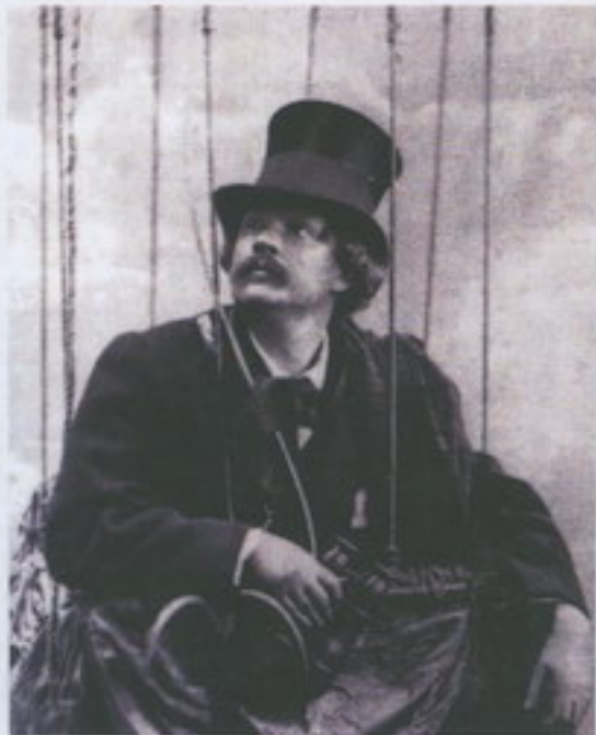
Nadar en 1863

Association pour la Photographie Ancienne & ses techniques