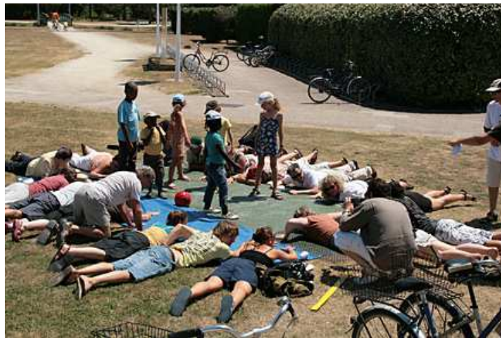
Maquette et répétition sur les positions du plus grand Van Dyke

1er juillet - 35°C – 14h. Nous étendons sur le sol le Van Dyke montrant sa couleur jaune pâle. En une fraction de seconde, chacun prend position selon les repérages fait peu avant durant la répétition, les enfants debout au centre et les "fans" couchés autour dans une immobilité irréprochable.