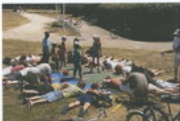
Maquette et répétition sur les positions du plus grand Van Dyke

1er juillet - 35°C - 14h. Nous étendons sur le sol le Van Dyke montrant sa couleur jaune pâle. En une fraction de seconde, chacun prend position selon les repérages fait peu avant durant la répétition, les enfants debout au centre et les "fans" couchés autour dans une immobilité irréprochable.