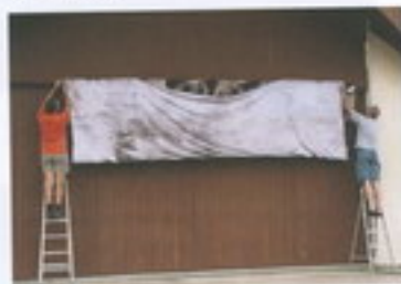
Etendage en public du plus grand Van Dyke

Cinq minutes plus tard, les acteurs se relèvent. Le Van Dyke est désormais plié et mis à l'abri de la lumière. Après 2h de traitement pour les opérations de fixage et de lavage, voilà le plus grand Van Dyke prêt à se révéler au public.... séquence émotion pour les acteurs, les spectateurs nombreux et les organisateurs! Great!