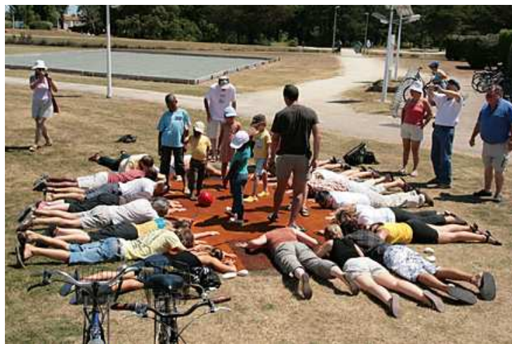
Insolation du plus grand Van Dyke

Le soleil chauffe, les acteurs transpirent et l'épreuve vire vite, très vite, au jaune "chaud" puis vers l'orange jusqu'à une couleur rouille écarlate.