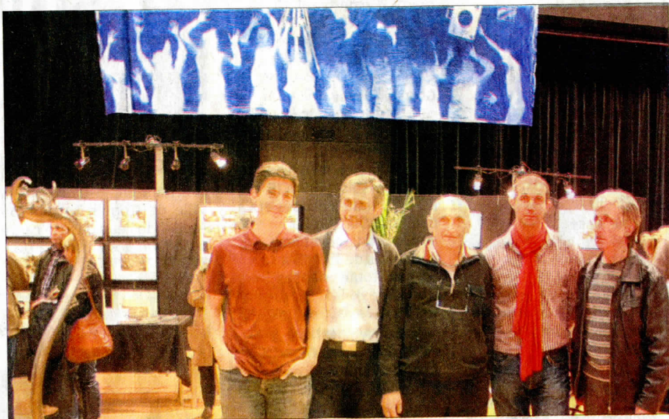
Une partie des photographes, dessous le cyanotype qui montre la vie la vie en bleu.

Pour en savoir plus : Horaires d'ouverture : samedi de 10 h à 19 h. Dernier jour dimanche 27 janvier : de 10 h à 18 heures http://www.artgentik73.fr/Rencontres/ . Entrée libre.