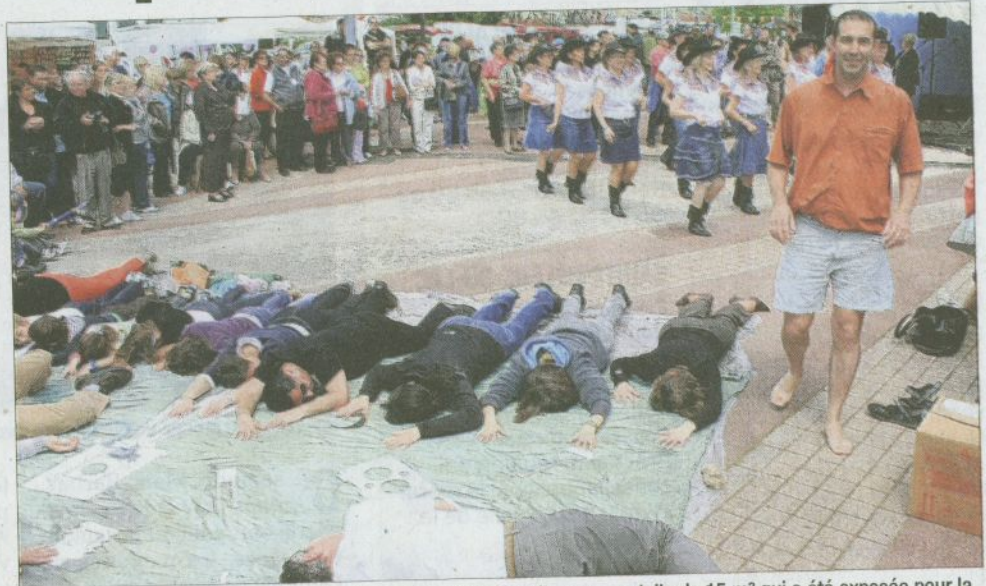
Les volontaires ont joué le jeu. Ils ont pris la pose sous le soleil, pour une toile de 15 m 2 qui a été exposée pour la fête.