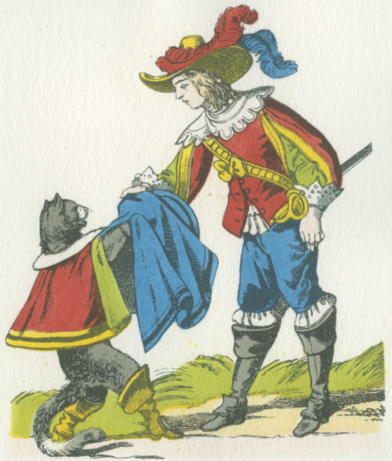
LE CHAT BOTTÉ

© Imagerie d'Épinal Coloris aux pochoirs à la main